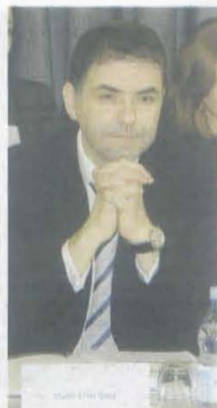
Predaje na UDG: Ivanović

Podgorica - Centar za građansko obrazovanje (CGO) podnio je inicijativu premijeru Milu Đukanoviću da razriješi dužnosti šest ministara koji krše član Ustava o nespojivosti funkcija.